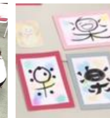
笑い文字とハートの小物入れ