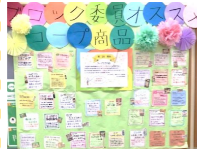
おススメ商品の掲示

2024年3月10日(日)コープときわ店にて開店25周年をお祝いする周年祭を開催しました。 東京7ブロック委員会からは、コープ商品に興味を持ってもらえるように、おススメ商品の掲 示や一言メッセージを書いた商品POPを商品棚に設置しました。また、小さなお子さんからご 年配の方までみんなに大人気のお菓子釣りでは、新商品も登場!! お祝いメッセージのコーナー では、多くの方に立ち寄っていただき、桜の木が満開となるたくさんのメッセージをいただきま した。皆さま温かいお言葉をありがとうございました。