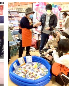
お菓子釣りの様子