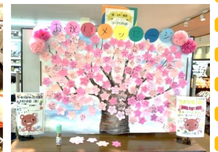
お祝いメッセージの木